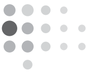
Figura 1: Salariul net pentru diferite categorii de profesori